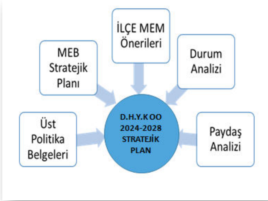
Tablo 1.2. Stratejik Planlama Modeli

kurulmuştur. Strateji Geliştirme Kurulu stratejik planlama çalışmalarının her aşamasında destekleri ile Stratejik Planlama Ekibi çalışmalarına pozitif katkı sunmuştur. 2024-2028 Stratejik Planı hazırlanırken katılımcı bir anlayış benimsenmiştir